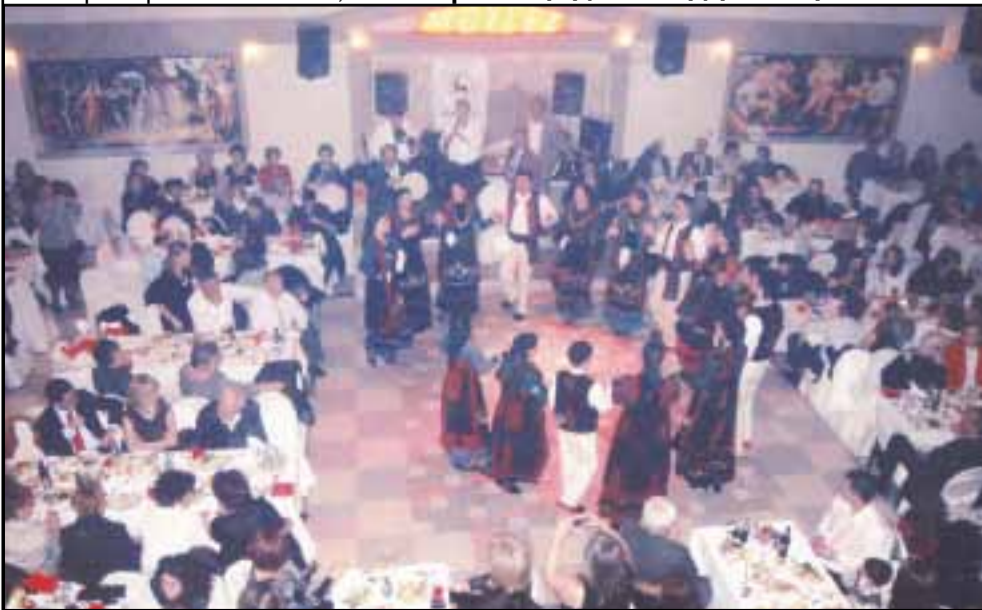
Κοσμικό Κέντρο «ΜΟΥΣΕΣ», Αλεξάνδρεια Ημαθίας Μερική άποψη απ' το γλέντι 20-2-2010