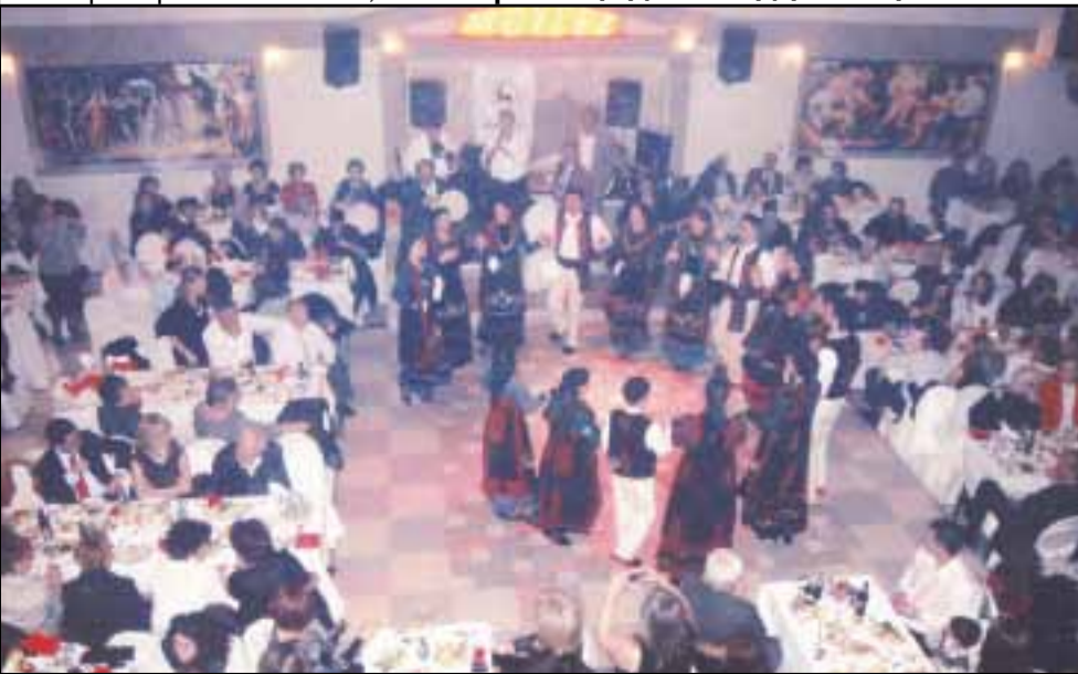
Κοσμικό Κέντρο «ΜΟΥΣΕΣ», Αλεξάνδρεια Ημαθίας Μερική άποψη απ' το γλέντι 20-2-2010