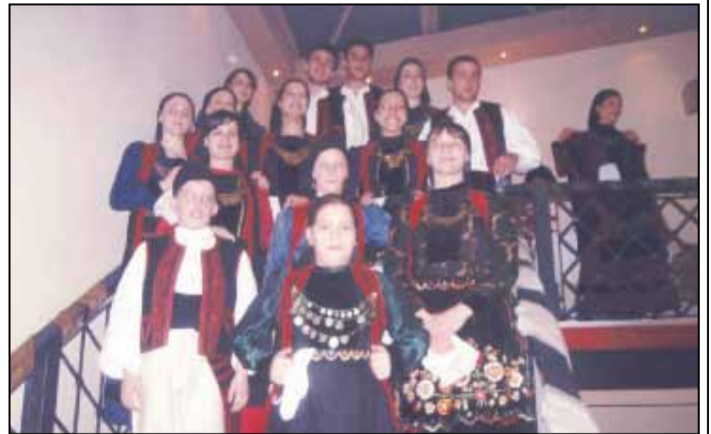
ΧΟΡΕΥΤΙΚΟΣ ΟΜΙΛΟΣ ΒΡΥΣΧΩΡΙΟΥ Κοσμικό Κέντρο «ΜΟΥΣΕΣ» 20-2-2010