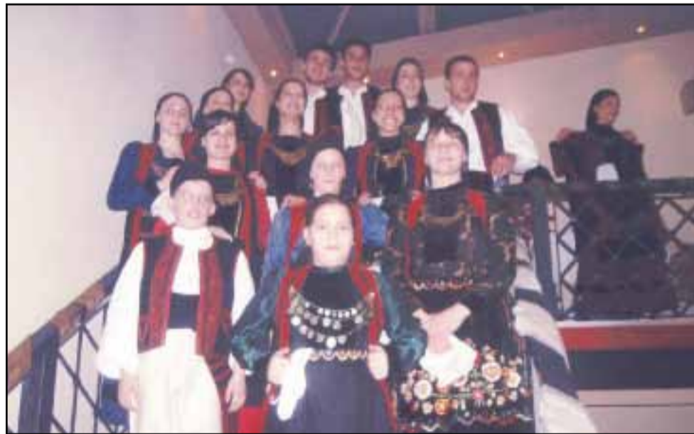
ΧΟΡΕΥΤΙΚΟΣ ΟΜΙΛΟΣ ΒΡΥΣΧΩΡΙΟΥ Κοσμικό Κέντρο «ΜΟΥΣΕΣ» 20-2-2010